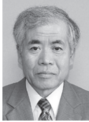
生ごみリサイクル推進委員会様

平成17年5月の発足以来、砥川の土手草刈りやヨシ焼き作業を行うなど、砥川の環境美化・治水活動に貢献されました