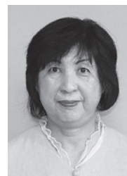
有限会社 高山精工様

多年にわたり、国道142号線花見新道一帯に花を植え、除草・整備を行うなど町内の環境美化活動に貢献されました