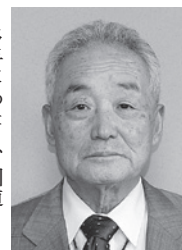
湯田町高齢者クラブ寿会様

多年にわたり、国道142号線花見新道一帯に花を植え、除草・整備を行うなど町内の環境美化活動に貢献されました