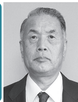
有限会社ヒノデ化工様 （西赤砂）

一般寄附。会社創立50周年記念に、ふるさとまちづくり寄附金として多額の寄附をされました