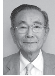
砥川を愛する会様

多年にわたり、諏訪湖博物館・赤彦記念館に展示・活用する資料として自作の水墨画を寄附されました